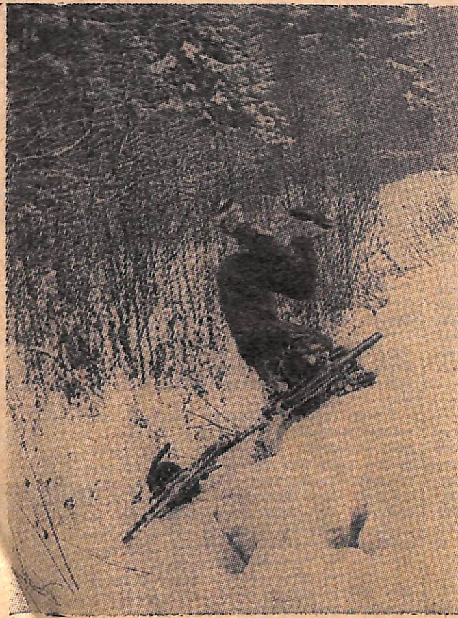
Из коллекции НФС «Образ». Оверкиль. Фото Е. ЖДАНОВА.